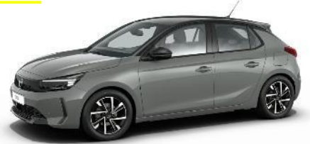
Šedá Grafik (SDP0) 500 €