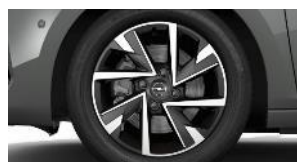
16" čierne disky z ľahkej zliatiny s výbrusom Diamond Cut (ZH*9D/*H8/*iB)