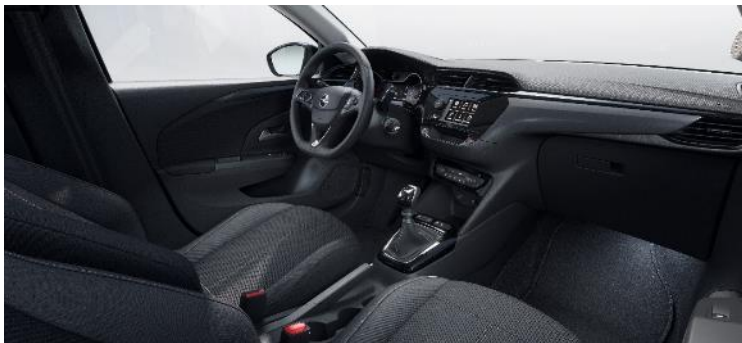
Komfortné sedadlá, látkové čalúnenie čierne Fresez, sedadlo vodiča nastaviteľné v 6 smeroch (BPFX) 0 €