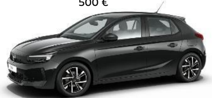
Čierna Karbon (9VM0) 500 €