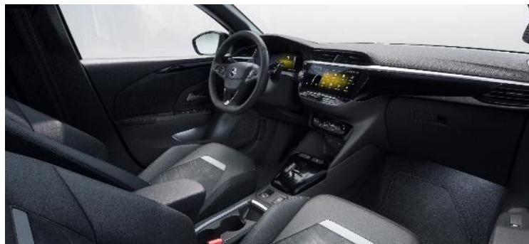
Čalúnenie Alcantara, čierne Jet Black, sedadlo vodiča s bedernou opierkou a masážnou funkciou, vyhrievané predné sedadlá a vyhrievaný volant (1UFX) 0 €