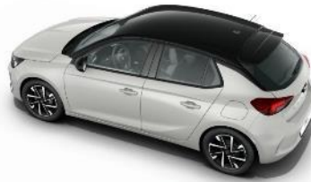
Čierna strecha Diamond Black (JD20) GS & Ultimate štandard