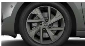
16" šedé disky z ľahkej zliatiny (ZH*9B/*H0/*H3)