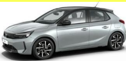
Strieborná Kristall (ZRMO) 0 €