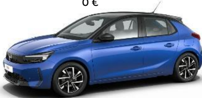
Modrá Voltaik (AVM0) 500 €