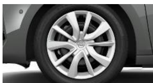
16" ocelové disky s krytmi v striebornej farbe (ZH*HU/*G6)