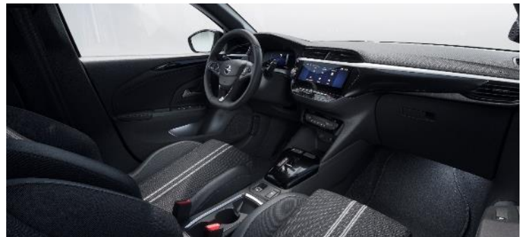
Látkové čalúnenie Banda, čierne s bielymi pruhmi, športové tvarovanie sedadiel (D4FV) 0 €