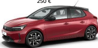
Červená Kardio (PQM0) 500 €