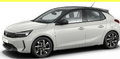
Biela Arktis (WPP0) 250 €