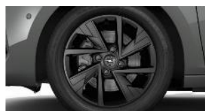
16" čierne disky z ľahkej zliatiny (ZH*9C/*H4/*H7)