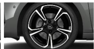
17" čierne disky z ľahkej zliatiny s výbrusom Diamond Cut (ZH*9G/*NJ/*G3)